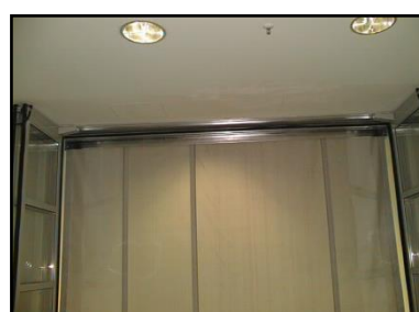
Barreras cortafuegos sin guías