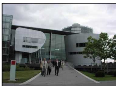
Barreras cortafuegos sin guías