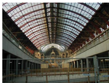
Cortina cortafuegos con salida de emergencia y sin guías laterales