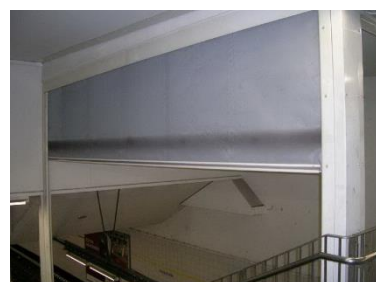
Cortina cortafuegos con guías laterales