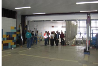
Cortina cortafuegos con guías laterales