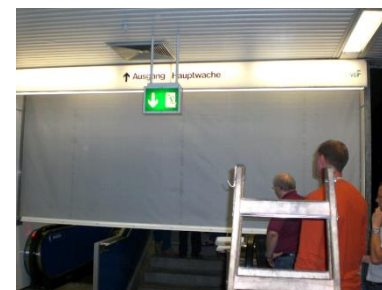
Cortina cortafuegos con guías laterales