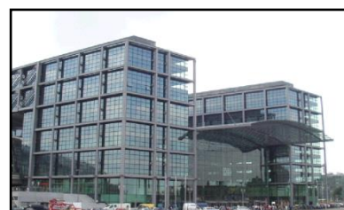
Cortina cortafuegos sin guías laterales